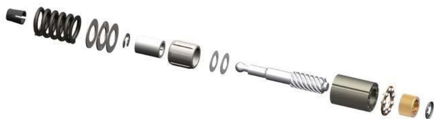
Meccanica interna: Unità di serraggio e regolazione BPW